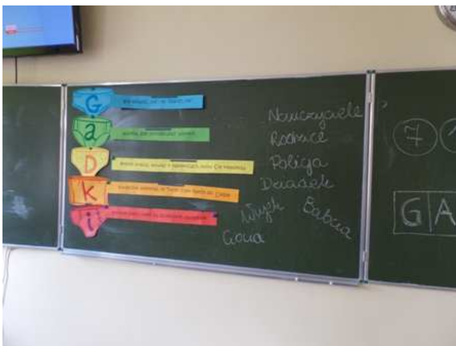
Zajęcia Klasy I – IV szkoły podstawowej