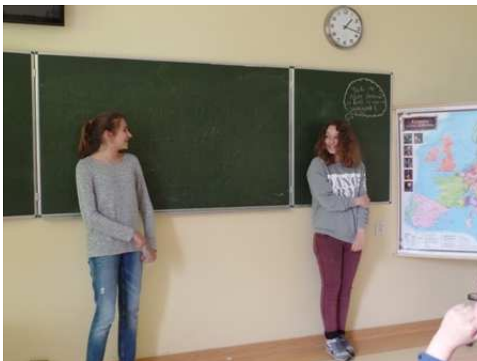
Zajęcia Klasy V-VI szkoły podstawowej