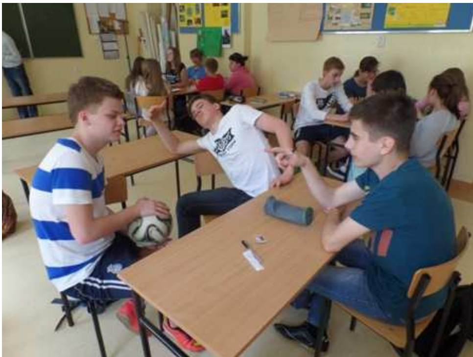
Zajęcia Klasy I –III gimnazjum